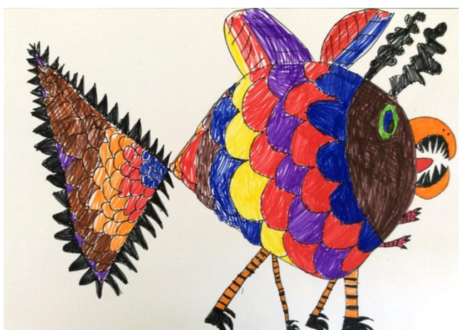
1. miesto: ALEX POŠIVÁK, 1. A

LEGO bolo veľkým lákadlom, nuž sa všetci veľmi snažili. A tu sú výsledky.