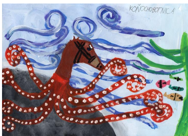
2. miesto: MICHAL PRIHATNÝ, 3. B